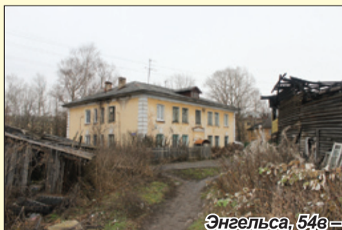
Энгельса, 54в – благоустройство территории