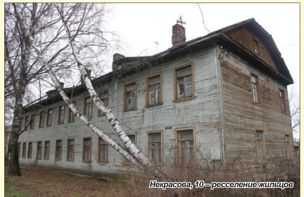
Некрасова, 10 – расселение жильцов