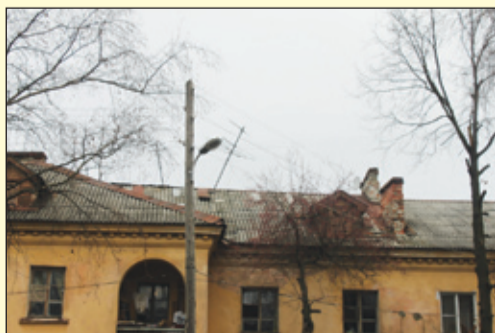
Энгельса, 58 – ремонт кровли

Хотелось бы выразить благодарность кандидату в депутаты городской думы по округу № 15, а теперь, возможно, представителю по Заречному округу в Законодательное собрание по Вологодской области от жителей дома, проживающих по адресу ул. Добролюбова, дом 52. А теперь по порядку: