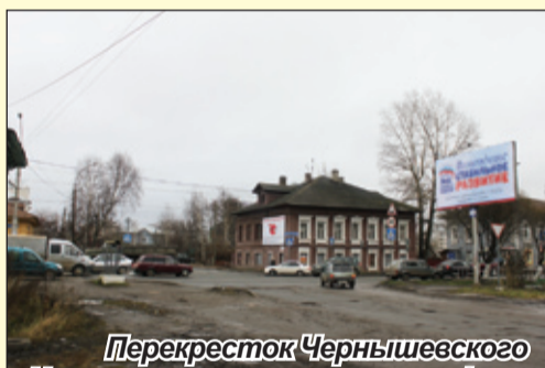
Перекресток Чернышевского – Некрасова – установка светофора