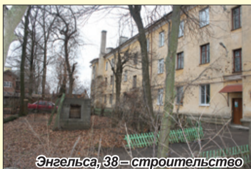
Энгельса, 38 – строительство детской площадки