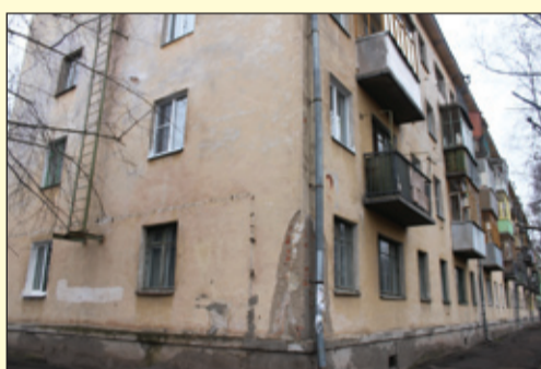
Некрасова, 9 – ремонт фасада