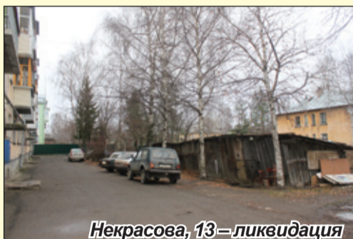
Некрасова, 13 – ликвидация во дворе ветхой застройки