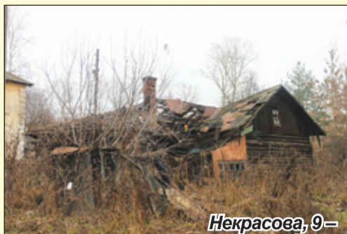
Некрасова, 9 – вывоз мусора сгоревшего дома