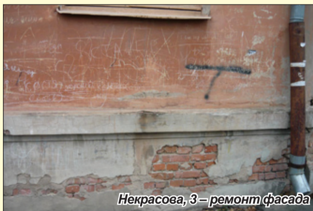
Некрасова, 3 – ремонт фасада